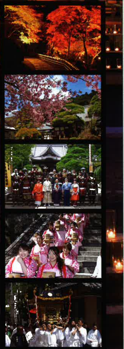
배경 사진은 '슈젠지 온천 켄들 나이트'의 모습입니다.

슈젠지 온천의 비밀 비밀 1 '슈젠지 절'의 미즈야(참배객이 입이나 손을 씻는 곳)는 무려 온천입니다! 참배 전에 따뜻한 온천수에 손을 깨끗이 씻은 뒤 참배합니다. 또한 시즈오카현에서 최초로 식용 온천수 허가를 취득해 온천수를 마실 수 있습니다! (슈젠지 절) 비밀 2 '오유카케 지고 대사'에게 온천수를 뿌리고 건강을 기원하세요! 자녀와 본인의 건강을 기원하시는 분이나 질병이 있는 분 등은 '지고 대사'(고보 대사의 어린 시절 이름)에게 소원을 담아 '온천수를 뿌려'(오유카케) 보세요. 대사님이 반드시 소원을 이뤄 주실 거예요! (돛코 공원) 비밀 3 '미백 효과'도 있다!? 슈젠지 온천의 온천성분 pH값은 '8.6'으로 수치가 높아 미백에 효과가 있는 온천으로 알려져 있습니다. 온천에 몸을 담가 윤기 있는 피부로 가꾸세요! (슈젠지 온천)