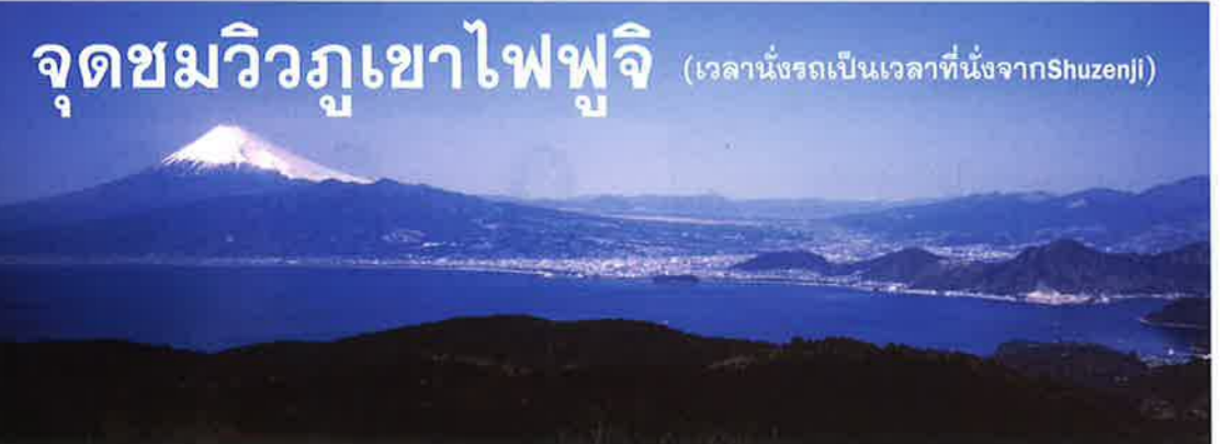
จุดชมวิวกุเอะไฟฟูจิ (เวลานั่งรถเป็นเวลาหนึ่งชั่วโมงจาก Shuzenji)

อธิบายคำศัพท์ *1 Natsume Soseki นักเขียนนิยายท่านหนึ่งที่มีชื่อเสียงในช่วงต้นศตวรรษที่ 20 ค.ศ. 1900 *2 พระ Kobo (Kukai) พระสงฆ์รูปหนึ่งที่มีชื่อเสียงมากในประเทศญี่ปุ่นในช่วงต้นสมัยเฮอัน (ปี ค.ศ. 794 ถึงราวปี ค.ศ. 1185) *3 สมัยคามาคุระ สมัยที่รัฐบาลตั้งอยู่ในเมืองคามาคุระ ตั้งแต่ราวปี ค.ศ. 1185 ถึงปี ค.ศ. 1333 *4 ท่านหญิง Hojo Masako ภริยาของผู้ก่อตั้งรัฐบาลคามาคุระ Minamoto no Yoritomo *5 Minamoto no Yorie ผู้นำ (โชกุน) คนที่ 2 ของรัฐบาลคามาคุระ เป็นบุตรชายของ Minamoto no Yoritomo ซึ่งเป็นผู้ก่อตั้งรัฐบาลคามาคุระกับท่านหญิง Hojo Masako