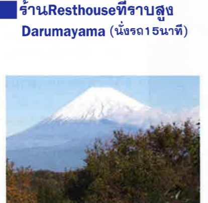
ร้าน Resthouse ที่ราบสูง Darumayama (นั่งรถ 15 นาที)

ในงาน New York EXPO เมื่อปี ค.ศ. 1939 ภาพพาโนรามาขนาด 8.2m X 32.7m ซึ่งเป็นภาพวิวของภูเขาไฟฟูจิที่ทัศนียภาพอันงดงามของประเทศญี่ปุ่นที่ถ่ายจากสถานที่แห่งนี้ได้ถูกนำขึ้นจัดแสดงโดยรัฐบาลญี่ปุ่นและได้รับคำชื่นชมอย่างล้นหลาม ภายใต้อาภรณ์ที่เบื้องหน้าเป็นฉากรวมภาพด้านซ้ายเป็นเทือกเขาแอลป์ได้และเทือกเขาอาโอะทางด้านขวา กล่าวได้ว่า "เป็นทัศนียภาพที่งดงามที่สุดของญี่ปุ่น"