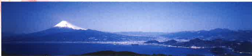
達磨山からの展望 (修善寺温泉から車で15分)

昭和14年に開催されたニューヨーク万国博へ、日本政府によりここから撮影した高さ8.2m、巾32.7m(268,14m)に及び大パノラマ写真が出品され、大称賛を博した。これは、日本の代表的な景白である富士山を、世界に紹介するため企画されたもので、当時旧名を受けた六桜社(現コニカミノルタ)の技師が、鯉河、甲州、信州など、富士山回りを一巡し、適地を探した結果、この達磨山を選んだといわれています。鯉河湖を前景に、左に南アルプス、右に箱根連山を従えた大パノラマは、まさに『日本一の展望地』といえます。