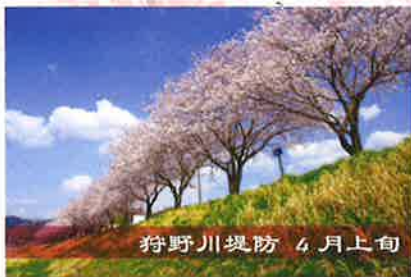
狩野川堤防 4月上旬