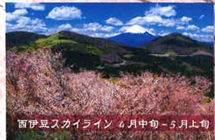
西伊豆スカイライン 4月中旬～5月上旬