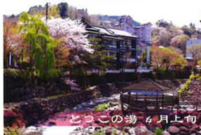
とうこの湯 4月上旬